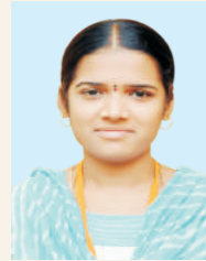
ಆಶಾ ಸಿ. ಯು. ಎಂ.