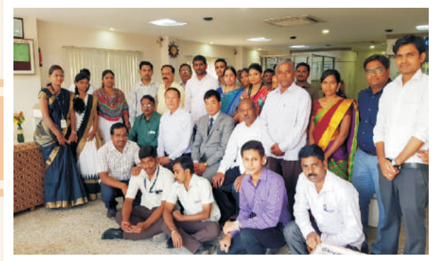
ಆರ್. ಬಿ. ಐ. ಅಧಿಕಾರಿಗಳೊಂದಿಗೆ ಬ್ಯಾಂಕಿನ ಆಡಳಿತ ಮಂಡಳಿ ಮತ್ತು ಸಿಬ್ಬಂದಿ ವರ್ಗ.