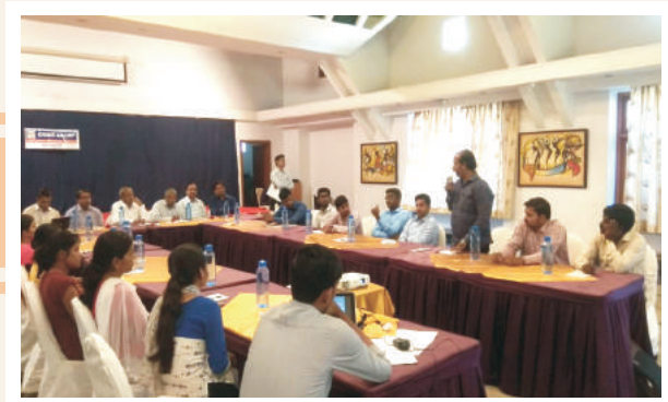
ನೂತನ ಸಿಬ್ಬಂದಿಗಳಿಗೆ ಪ್ರವೇಶ ತರಬೇತಿ.