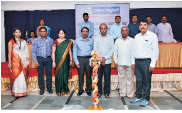
ವಿಶೇಷ ಸರ್ವಸದಸ್ಯರ ಸಾಮಾನ್ಯ ಸಭೆಯ ಉದ್ಘಾಟನೆ