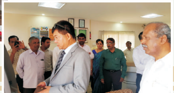
ಬ್ಯಾಂಕಿನ ಆಡಳಿತ ಮಂಡಳಿ ಸದಸ್ಯರ ಸಮ್ಮುಖದಲ್ಲಿ ಆರ್.ಬಿ.ಐ.ನ ಪ್ರಾಂತೀಯ ನಿರ್ದೇಶಕರು, ನಮ್ಮ ಬ್ಯಾಂಕ್ ಎ.ಟಿ.ಎಂ. ನಿಂದ ಹಣ ಪಡೆಯುತ್ತಿರುವುದು.