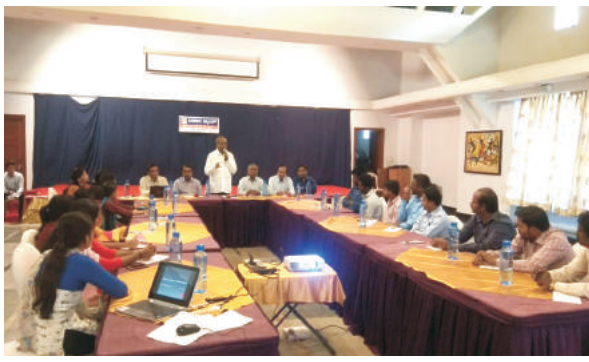
ನೂತನ ಸಿಬ್ಬಂದಿಗಳಿಗೆ ಪ್ರವೇಶ ತರಬೇತಿ ಕಾರ್ಯಕ್ರಮದಲ್ಲಿ ಅಧ್ಯಕ್ಷರ ನುಡಿ.