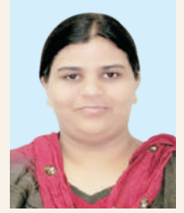
ಸೈಯದಾ ಫೈಸೀನ್ ಫಾತಿಮಾ