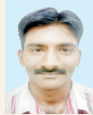
ಕೊಟ್ಟಗೌಡ ಕೆ. ಸಿ.