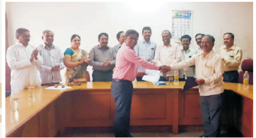
ಮುಧೋಳ ಬ್ಯಾಂಕಿನವರೊಂದಿಗೆ ಎಂ.ಓ.ಯು.ಗೆ ಸಹಿ ಹಾಕಿ ಎಂ.ಓ.ಯು.ವಿನಿಯಮ ಸಂದರ್ಭ