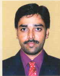
ಅರ್ಜುನಸಾ ಇ.ಆರ್. ಅಧಿಕಾರಿ