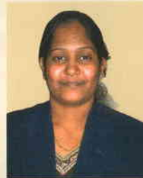
ನಯನಾ ಎನ್.ಎಸ್. ಅಧಿಕಾರಿ