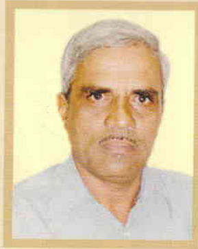
ಶ್ರೀ ವೀರಯ್ಯಾiah ನಿರ್ದೇಶಕರು