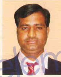
ಬಸಯ್ಯ ಜಿ. ಅಧಿಕಾರಿಗಳು