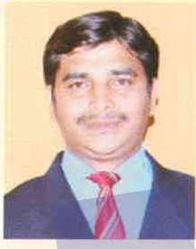
ಅಪ್ಪಾಜಿ ಸಂಕರ್ ಅಧಿಕಾರಿಗಳು